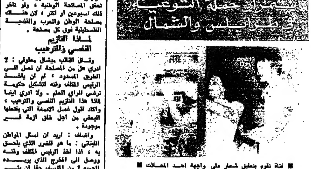
خانة تقوم بتعليق شعار على واجهة احد المصالحات